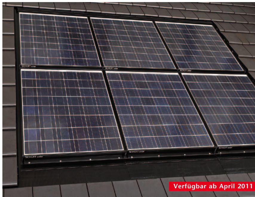
SCHOTT INDAX® 185

Das deutsche Traditionsunternehmen SCHOTT Solar bietet im Bereich Photovoltaik seit 2003 innovative und zertifizierte dachintegrierte Lösungen auf Basis der bewährten kristallinen Technologie an. Die InDaX® Solarelemente der 4. Generation ersetzen vollständig die altbekannten Dachbaustoffe und übernehmen eine Doppelfunktion: solare, saubere Stromerzeugung und sichere Dachhülle.