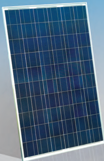
Moduli solari Muticristallini da alta efficienza