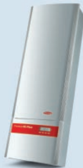
Fronius IG Plus 120/ Fronius IG Plus 150

Gli apparecchi bifase per impianti di grandi dimensioni sono disponibile in opzione anche come apparecchi monofase. Potenza in uscita da 6,5 o 8 kW.