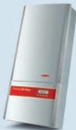
Fronius IG Plus 70/ Fronius IG Plus 100

Potente e compatto. Entrambi gli apparecchi con potenza in uscita di 3,5 o 4 kW per impianti fotovoltaici, per esempio nelle villette unifamiliari.