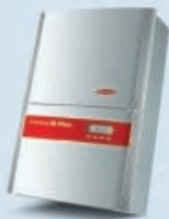
Fronius IG Plus 35/ Fronius IG Plus 50

Potente e compatto. Entrambi gli apparecchi con potenza in uscita di 3,5 o 4 kW per impianti fotovoltaici, per esempio nelle villette unifamiliari.