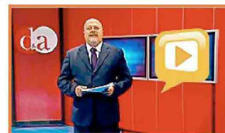
Puntata del 17 dicembre 2010