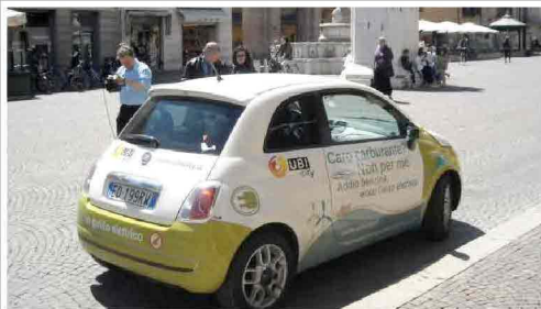
Rimini: i Solar Days puntano sulle auto "alla spina"

Domani all'interno del parco Fellini, una giornata dedicata energie rinnovabili e mobilità a emissioni zero con i test drive sulle Fiat 500 e le Smart elettriche targate Uicity