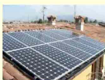
clicka sull'immagine per ingrandire

di Valerio Mingarelli lunedì 23 luglio 2012 13:21